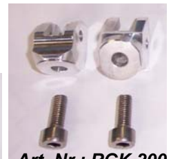
Art. Nr.: RGK 200